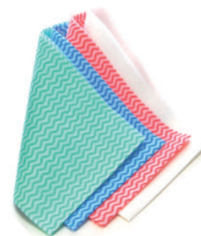
レギュラー（薄ロタイプ）