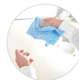
カスタム（厚ロタイプ）